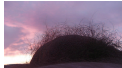
Sunset, videoloop, tyst, 2009