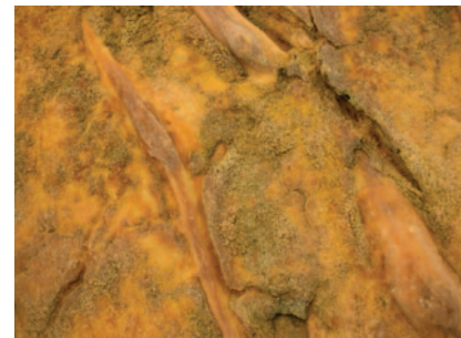
Path, latex, 0,7 x 3,5 m