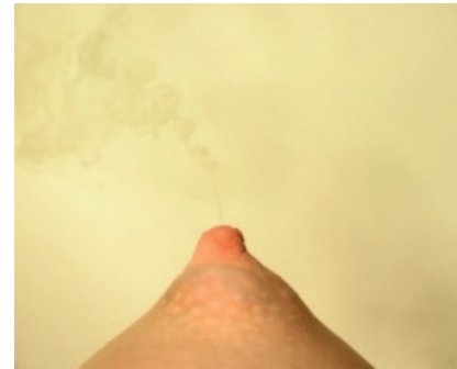
Volcano, videoloop, tyst, 2008

I Volcano sammanförs två samhöriga men samtidigt väsensskilda och gravt symbolbelastade kroppsdelar, nämligen bröstet och fallosen. Traditionellt symboliserar bröstet främst kvinnlighet, moderskap, livgivande. Dess mjölk betecknar i än högre grad omhändertagande, nytt liv, förening mellan moder och barn etcetera. Det förefintliga bröstet har en än mer explosiv, eruptiv funktion. Livgivande lemmar blir här vulkaniskt gift, spilld mjölk, spilld säd och, i förlängningen: föspillt liv och omöjlighet till liv. De könsrelaterade konnotationer som följer i sädesvätskan och bröstmjölkens led ruckas och osäkerhet kring vad vi egentligen ser och erfar uppstår. Följande kan dock konstateras: Ersmark sammanför, fusionerar och förenar symbolerna till den grad att de upplöses, legeras, blir del av samma sak. Något blir vad det liknar men blir i samma ögonblick helt annorlunda. I Sunset förväxlas och förblandas på ett likartat vis könsdrift och dödsdrift, två relaterade men samtidigt artskilda entiteter. Den spermie- och testosterontillverkande testikeln representerar manlighet, virilitet, möjlighet till nytt liv men är i all sin potens samtidigt ett av de sköraste av organ. Solnedgången representerar avtagande kraft, avmattning, död. Även den förment maskulina viriliteten har sina avigsidor. Javisst: det mesta är mer sammansatt, mer sammanblandat, mer mångfaldigt än vi kan föreställa