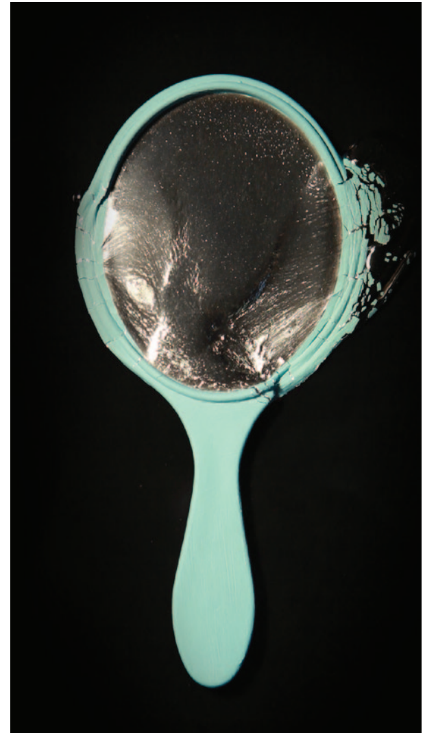
Mirror, videoloop, tyst, 2010