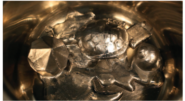
Casting, videoloop, tyst, 2009