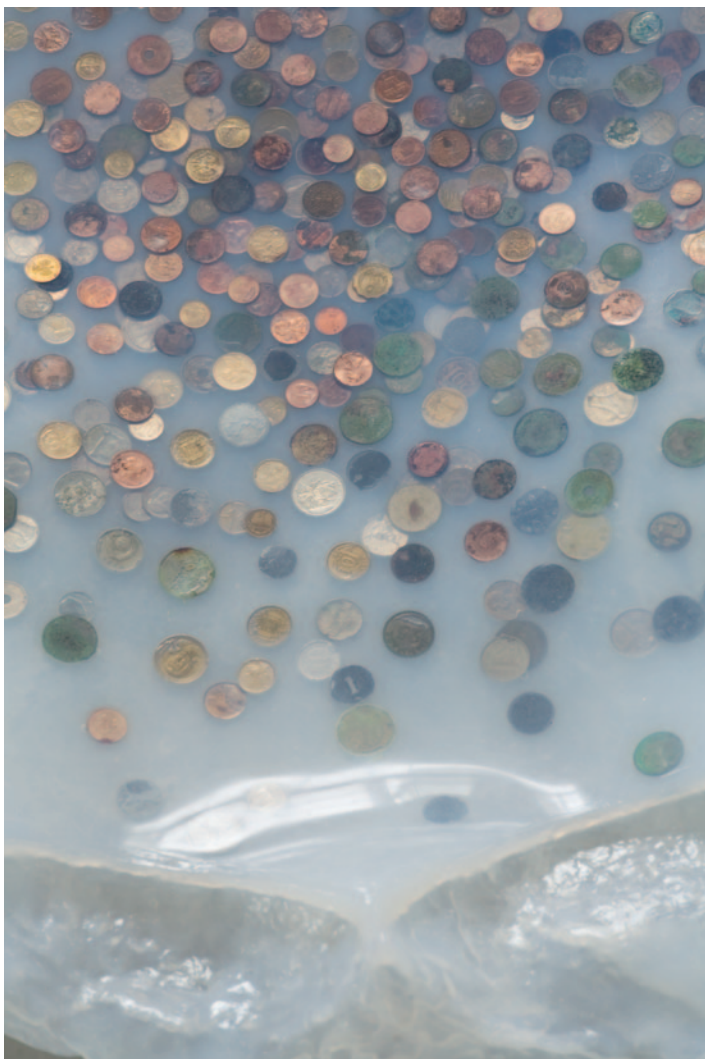
Wishing Well, silikon och mynt 1,5 x 4m 2010